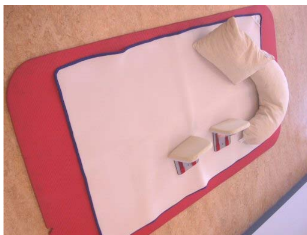
Individueel instelbaar matras