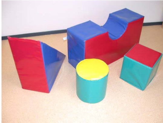
Grote zachte vormen schuimrubber