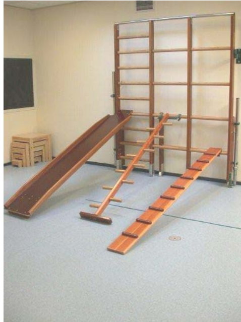
Klimrek, glijbaan, kippenladder