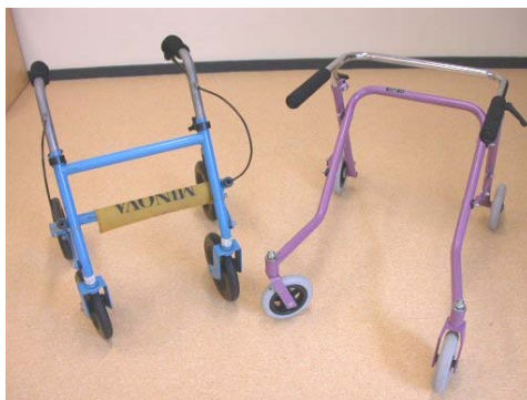
Hulpmiddelen zoals rollator en posterior walker