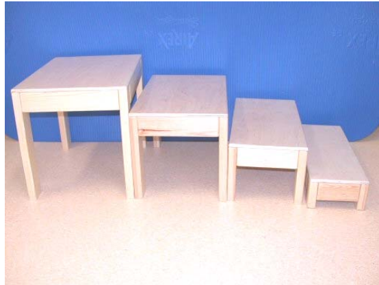
Bankjes in verschillende maten