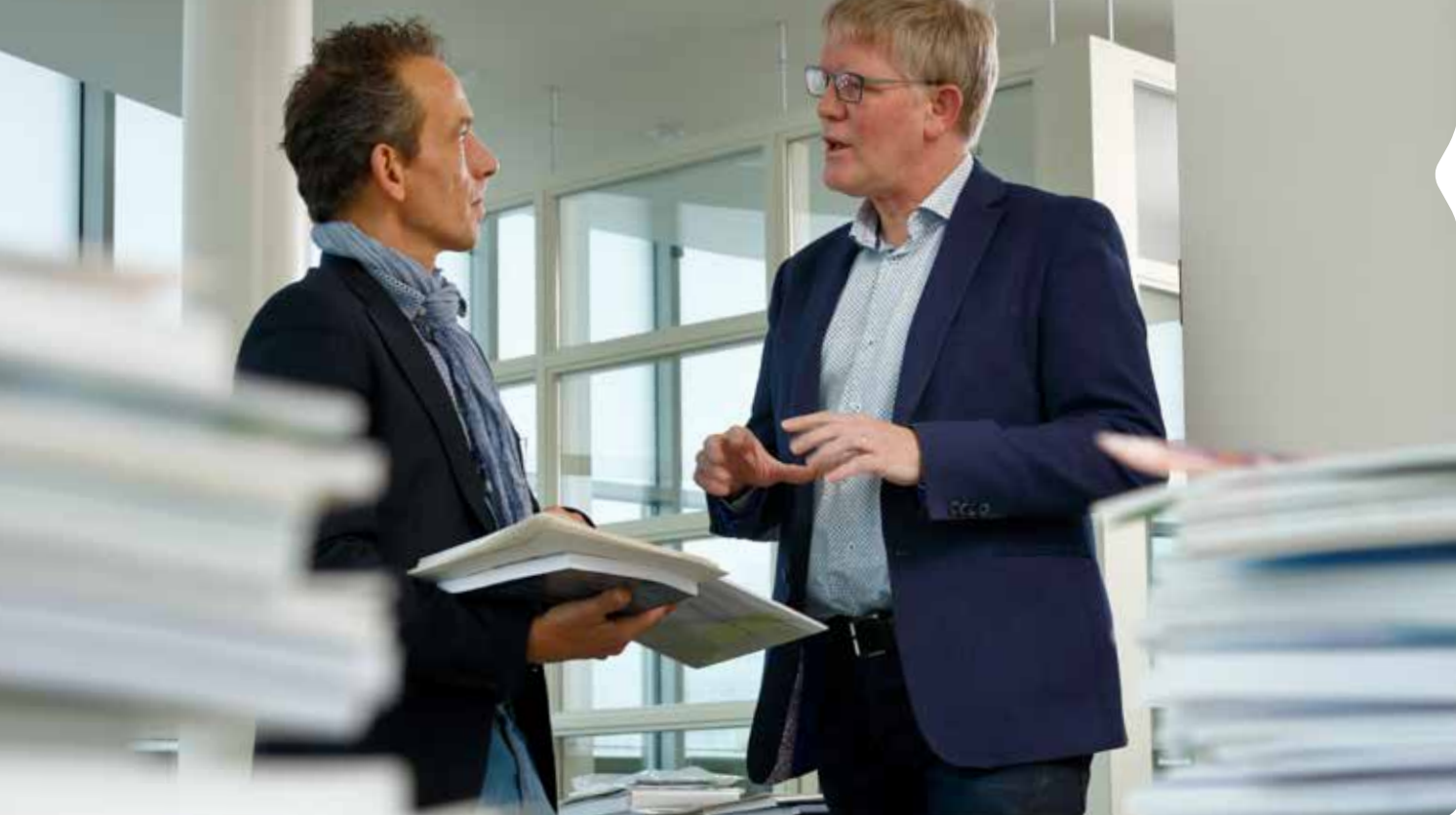
Tekst: Filip Bloem. Ook verschenen in Didactief, december 2016. • Fotografie: © Jan Scharfman