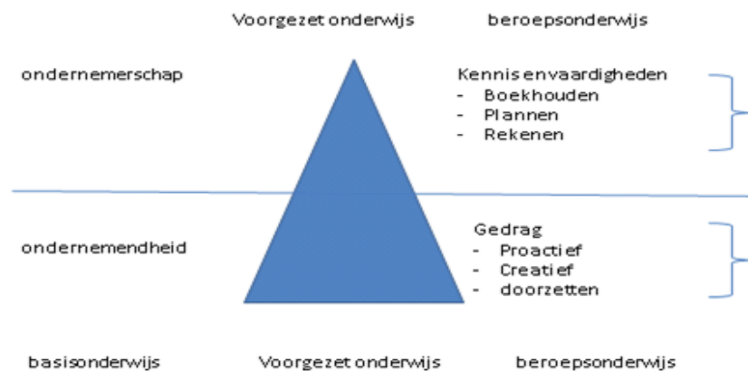
Afbeelding 1 Pyramide van ondernemerschap