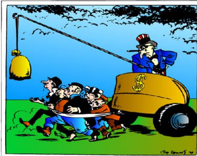
Een spotprent uit 1947 over de (economische) hulp van de VS aan Europa.