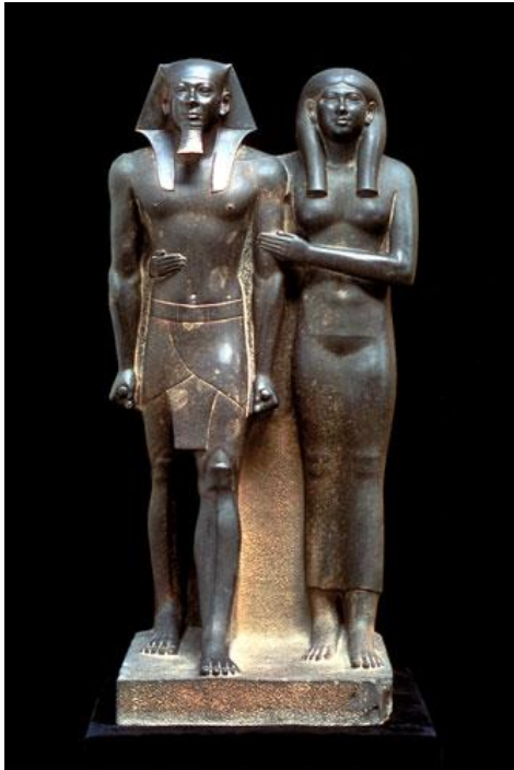
Bron: Beeld uit het oude Egypte