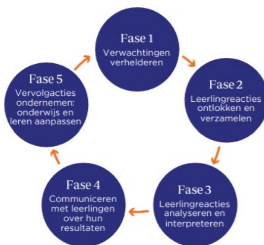
Cyclus formatief evalueren (Baartman en Gulikers, 2017)

Formatief evalueren gaat om alle activiteiten die leerlingen én leraar uitvoeren om de (leer)vorderingen van leerlingen in kaart te brengen, te analyseren en interpreteren en te gebruiken om betere beslissingen te nemen over vervolgstappen. Formatief evalueren is een cyclisch proces, waarbij de verschillende fasen steeds terugkeren binnen een les en/of lessenreeks, zoals Gulikers en Baartman (2017) laten zien in hun model van vijf fasen. Formatief evalueren biedt leerlingen inzicht in hun eigen leren en de leraar krijgt handvatten om onderwijs op maat te geven.