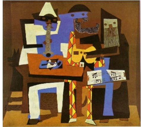
De drie muzikanten – Pablo Picasso (1921)

Binnen het project 'Expositie in de School' organiseren de leerlingen van groep 7 een expositie voor de ouders. Om inspiratie op te doen, hebben de leerlingen een bezoek gebracht aan een expositie in de buurt. De leerkracht en leerlingen hebben verschillende kunstwerken bekeken en besproken met behulp van de Visual Thinking strategies (zie kader op pagina 6). Voor hun eigen expositie hebben de leerlingen een aantal kunstwerken geselecteerd en bij elk kunstwerk schrijven zij een tekst (beschouwing). Deze lessenserie beschrijft de lesactiviteiten die de leerlingen uitvoeren bij het schrijven van een beschouwing. De lesactiviteiten zijn uitgewerkt aan de hand van de vijf fasen van de cyclus van formatief evalueren (Gulikers & Baartman, 2017). Hierdoor krijgen leerlingen inzicht in hun eigen leerproces en zijn zij in staat vaardiger te worden in het schrijven van een beschouwing.