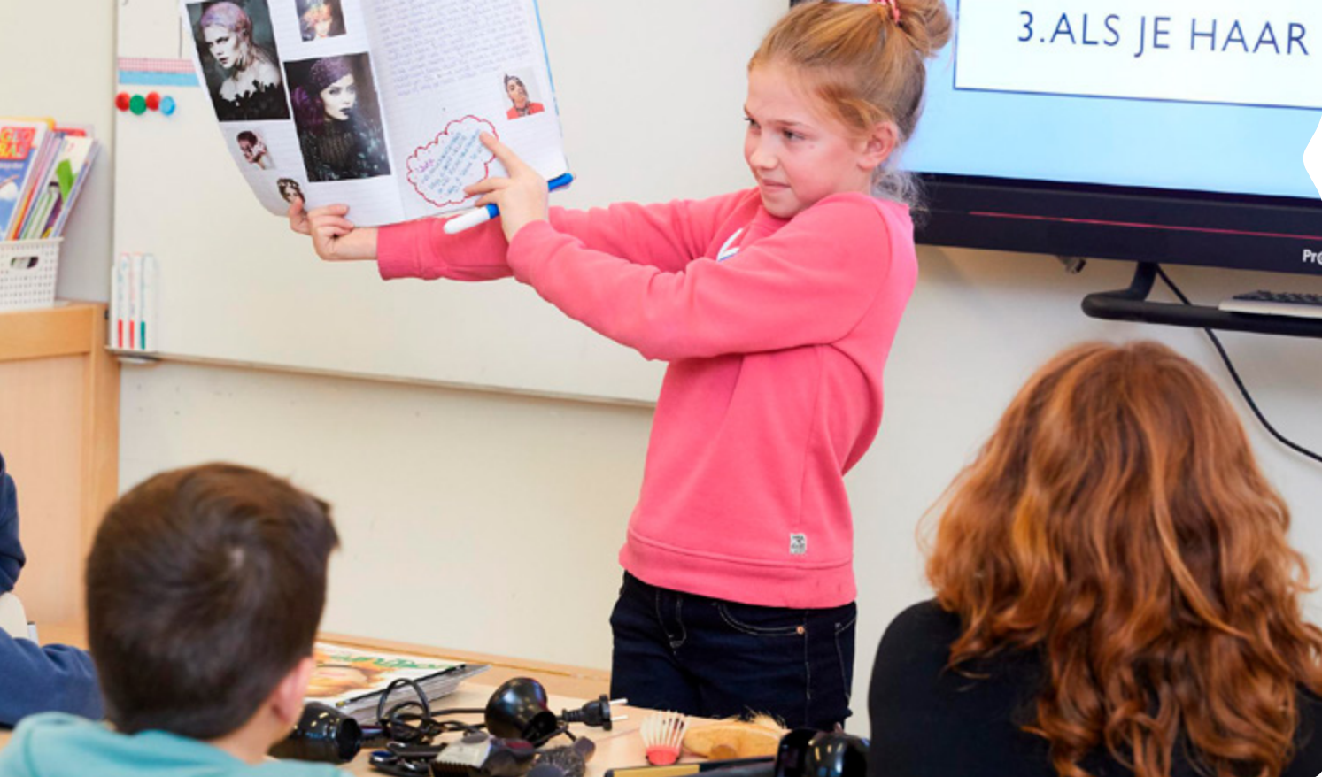
Tekst: Femke van den Berg