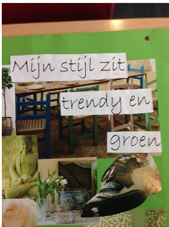
Voorbeeld van een titelblad